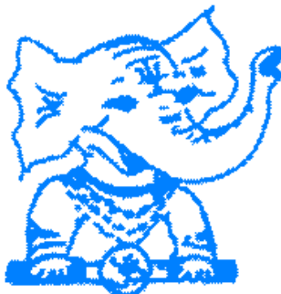
Ganesha TEAM www.ganeshateam.com